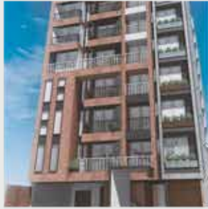
Lima II Jesús María - 39 departamentos