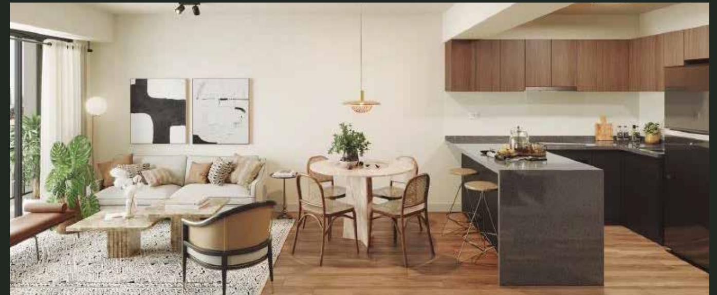
GRAY Edificio Multifamiliar (2023)

En V2 Arquitectos, el diseño es un trabajo en equipo enfocado en crear proyectos rentables, personalizados y de alta calidad. Acompañan cada etapa con asesoría integral, buscando soluciones funcionales que generen experiencias y mejoren la vida de los usuarios.