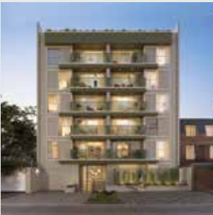
Ingreen Surco - 29 departamentos