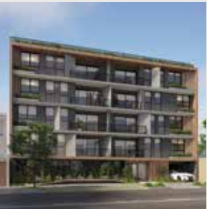
Instant Surco - 36 departamentos