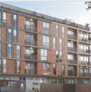
Intense San Borja - 34 departamentos