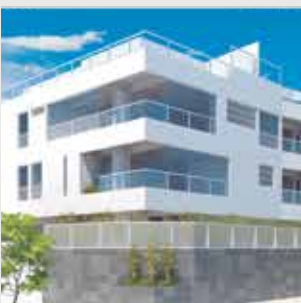
Inn San Borja - 7 departamentos