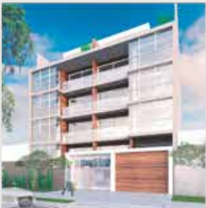
Menta San Borja - 16 departamentos