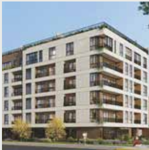
Insert San Borja - 24 departamentos