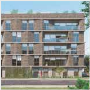
Invite San Borja - 14 departamentos