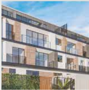
Arista San Borja - 15 departamentos