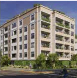
Andalusia San Borja - 26 departamentos