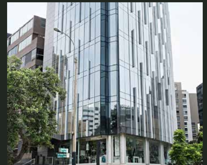
Proeycto Volterra (2025)

Con una mirada contemporánea y sensible al entorno, han creado espacios que conviven con lo natural sin perder elegancia ni funcionalidad. Rafael responde a una idea clara: vivir con calma, estilo y conexión familiar.