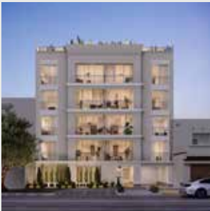
Antonia Miraflores - 21 departamentos