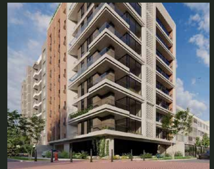
RZ - II Edificio Multifamiliar (2025)