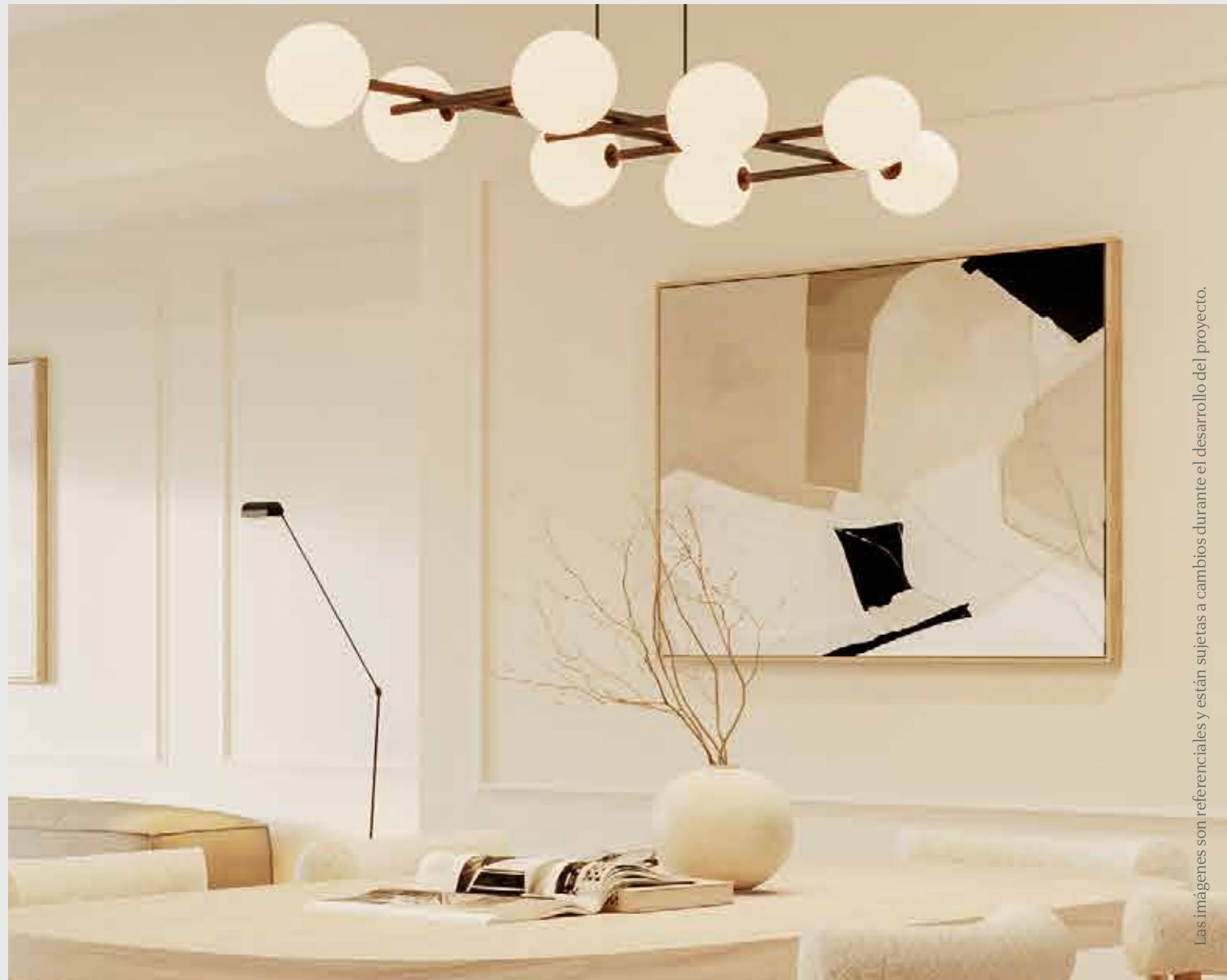
Las imágenes son referenciales y están sujetas a cambios durante el desarrollo del proyecto.

El comedor se presenta como un espacio de encuentro, donde la luz natural y la tranquilidad se combinan para crear el ambiente perfecto para compartir en familia o con amigos. Los pisos en tono madera de bambú, los zócalos altos y las paredes en blanco suave aportan serenidad y elegancia, mientras que los detalles de diseño se eligen con la intención de ofrecer un ambiente acogedor y atemporal. Cada elemento ha sido pensado para complementar tu estilo de vida, porque tu hogar debe reflejar el equilibrio entre belleza y funcionalidad.