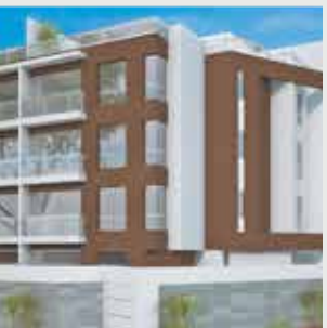
Allegra San Borja - 12 departamentos