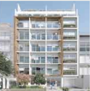
Influye Surco - 27 departamentos