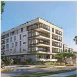
Infinity San Borja - 16 departamentos