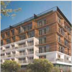
Rebel San Borja - 44 departamentos